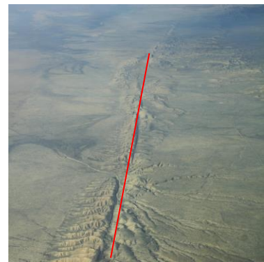
Photoaraphie de la faille de San

Un cycle sismique n'est pas parfaitement régulier, il dure entre 150 et 200 ans. Les deux derniers séismes importants ont eu lieu en 1857 et en 1906.