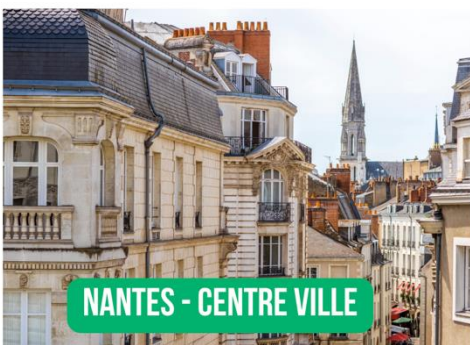
NANTES - CENTRE VILLE

Document 1 : Photographies de l'aire urbaine de Nantes.