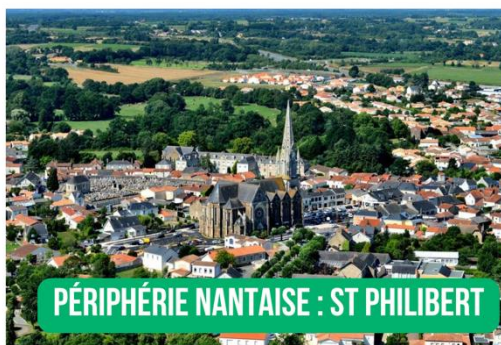
PÉRIPHÉRIE NANTAISE : ST PHILIBERT