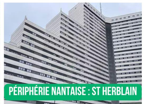
PÉRIPHÉRIE NANTAISE : ST HERBLAIN